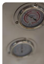
Lecture des pressions gaz