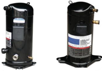
Compresseur Scroll EVI R407C Niveau sonore très bas