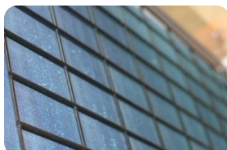
Echangeur de grande surface avec traitement hydrophile