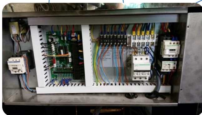
Régulation Motorola Contrôleur de phase