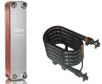
Option échangeur coaxial